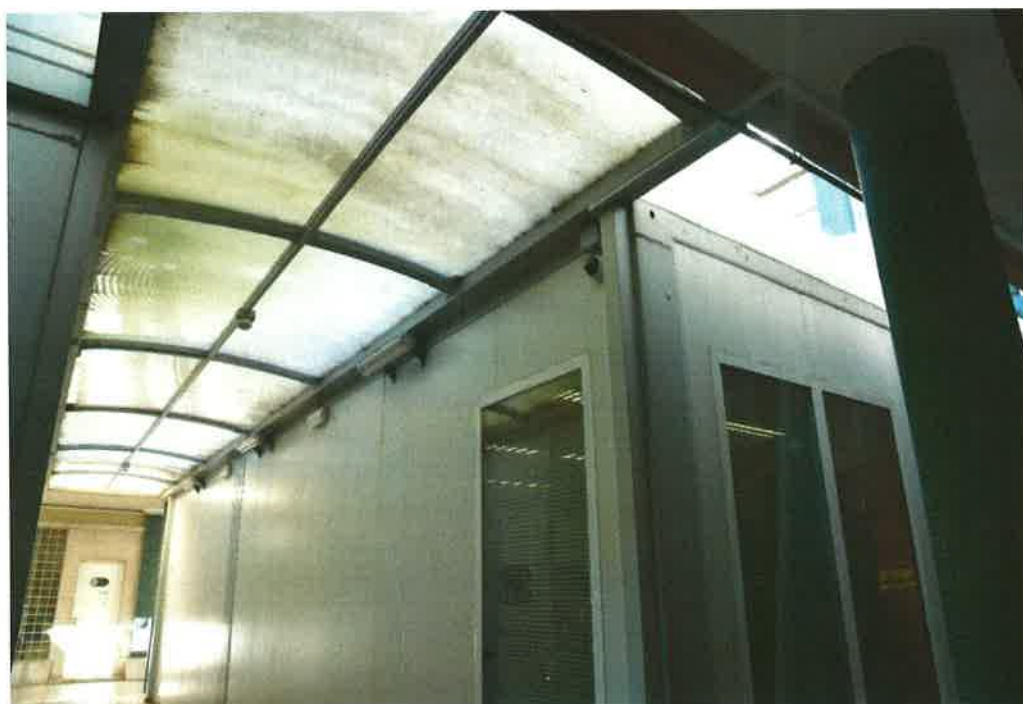
Vista exterior do módulo onde funciona a Secção Central, Palácio Justiça Vila Franca de Xira