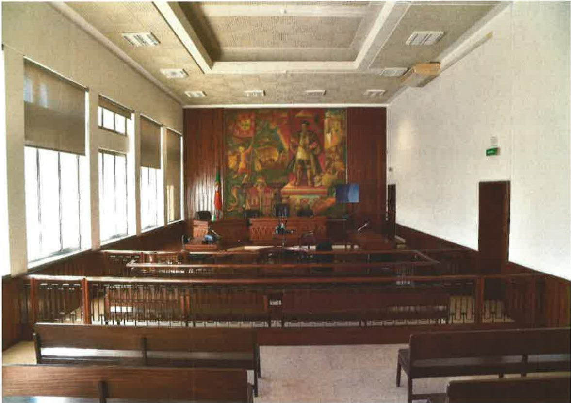
Sala de audiências Palácio de Justiça de Vila Franca de Xira

Tribunal Judicial da Comarca de Lisboa Norte Gabinete da Presidência Palácio da Justiça - 2670-502 Loures Tel. 219825200 Fax: 219825223 Email: loures.judicial@tribunais.org.pt