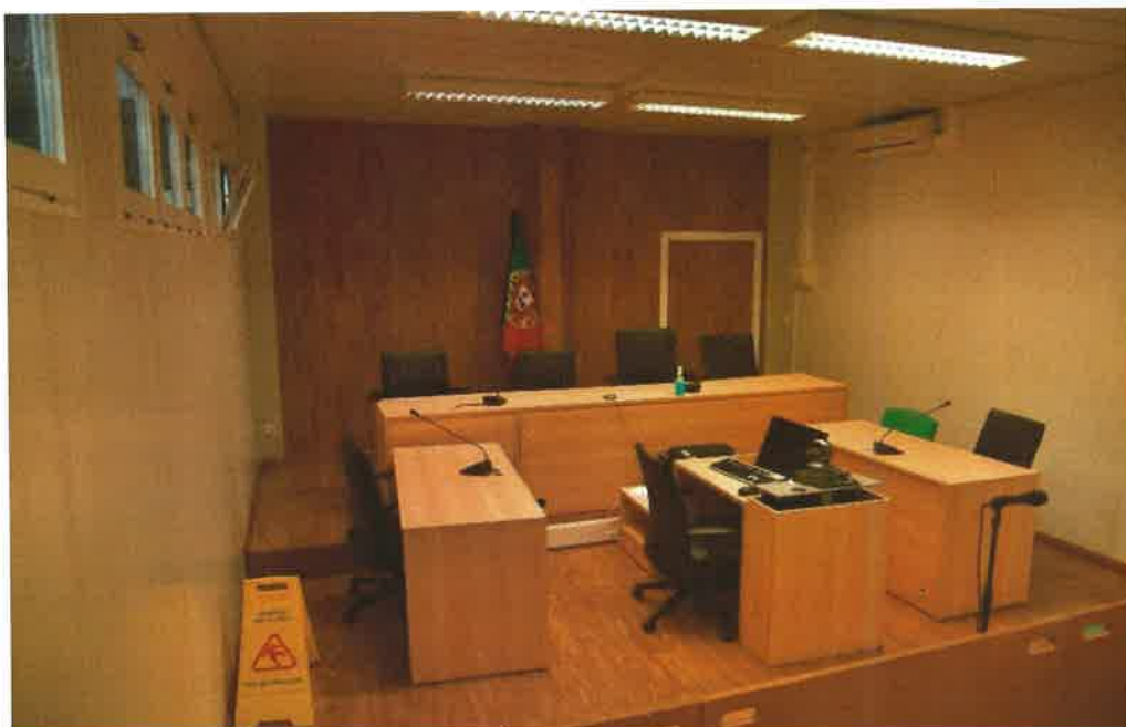
Sala de audiências Palácio Justiça Vila Franca de Xira, instalada num dos módulos transitórios. Assinala-se o local onde existe um buraco, onde o chão colapsou.

Tel. 219825200 Fax: 219825223 Email: loures.judicial@tribunais.org.pt