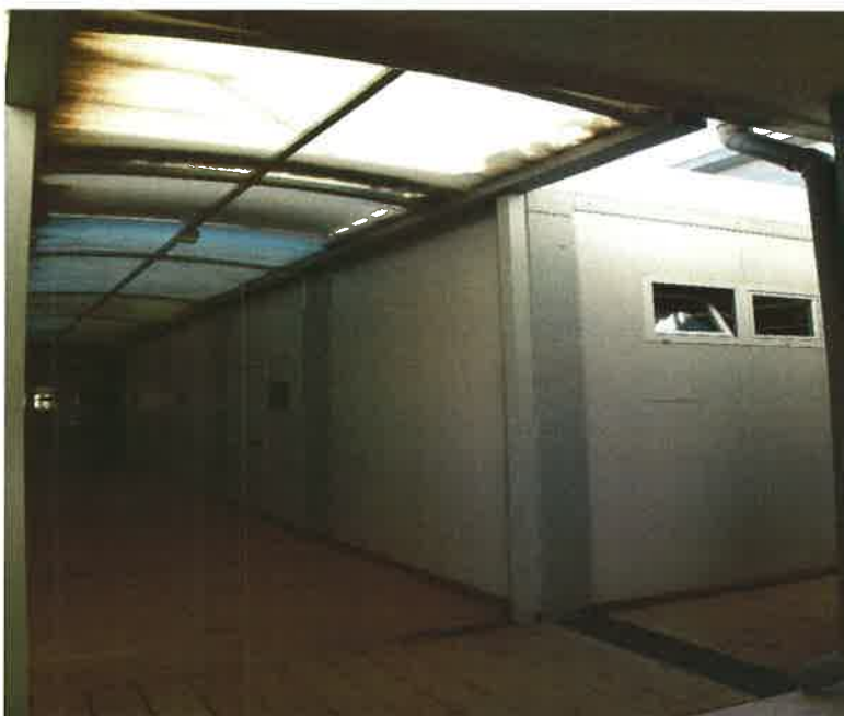
Vista do corredor e cobertura que ligam os módulos das salas de audiências à Secção Central

Tel. 219825200 Fax: 219825223 Email: loures.judicial@tribunais.org.pt