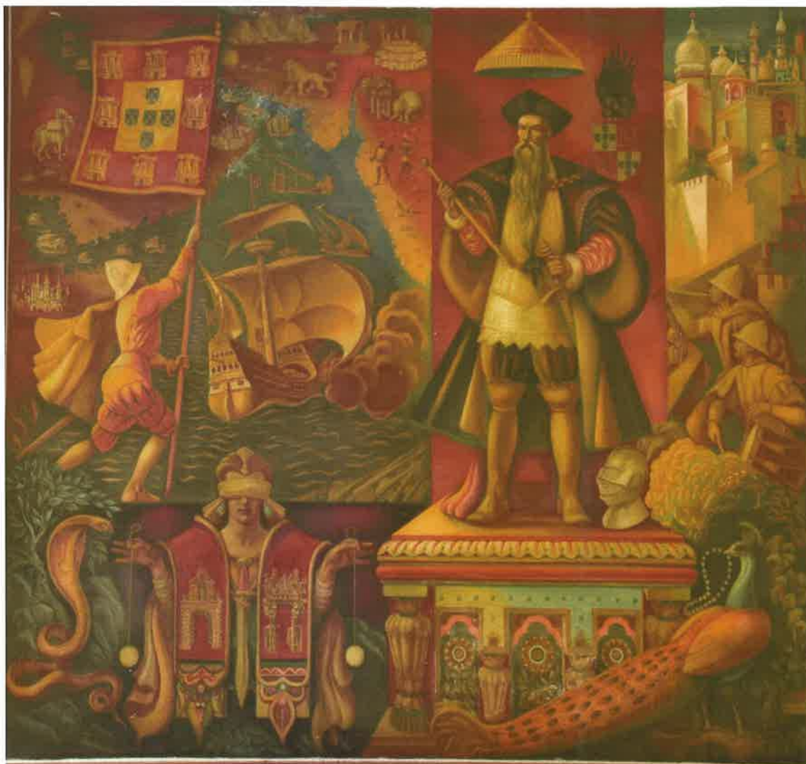
Painel Sala de Audiências Palácio de Justiça Vila Franca de Xira

Tel. 219825200 Fax: 219825223 Email: loures.judicial@tribunais.org.pt